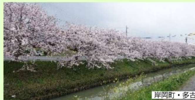
岸岡町・多古知川の桜並木

「乗車運賃無料のデマンドタクシー」を市内すみずみに走らせるために、引き続きがんばります。ご一緒に運動しましょうとお願いして懇談会を終えました。参加いただいた皆さんありがとうございました。